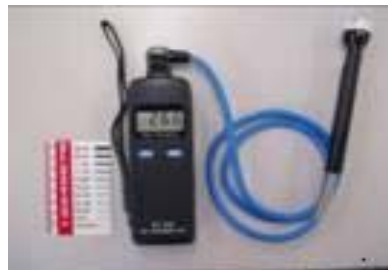
使用機器(接触型温度計)